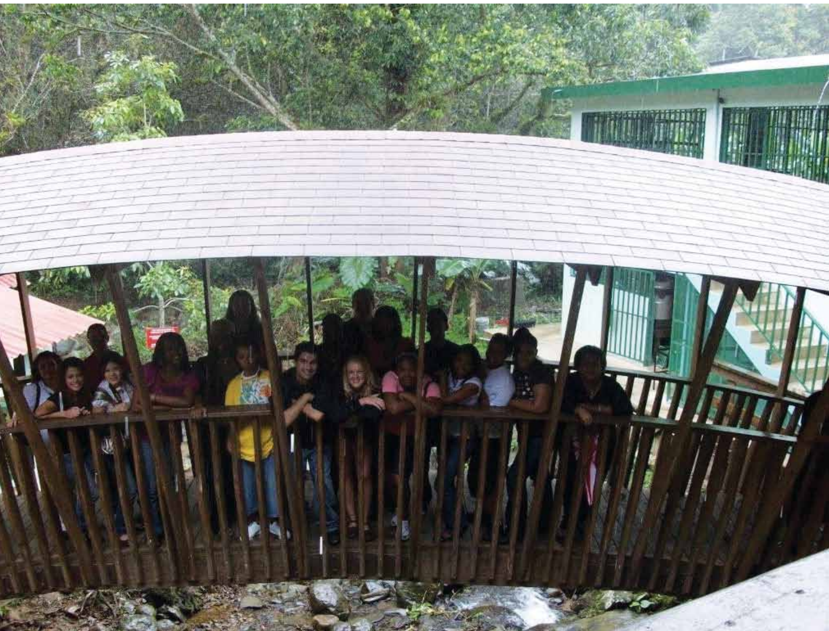
Estudiantes internacionales del Recinto Metro en una Gira Cultural a Guavate.