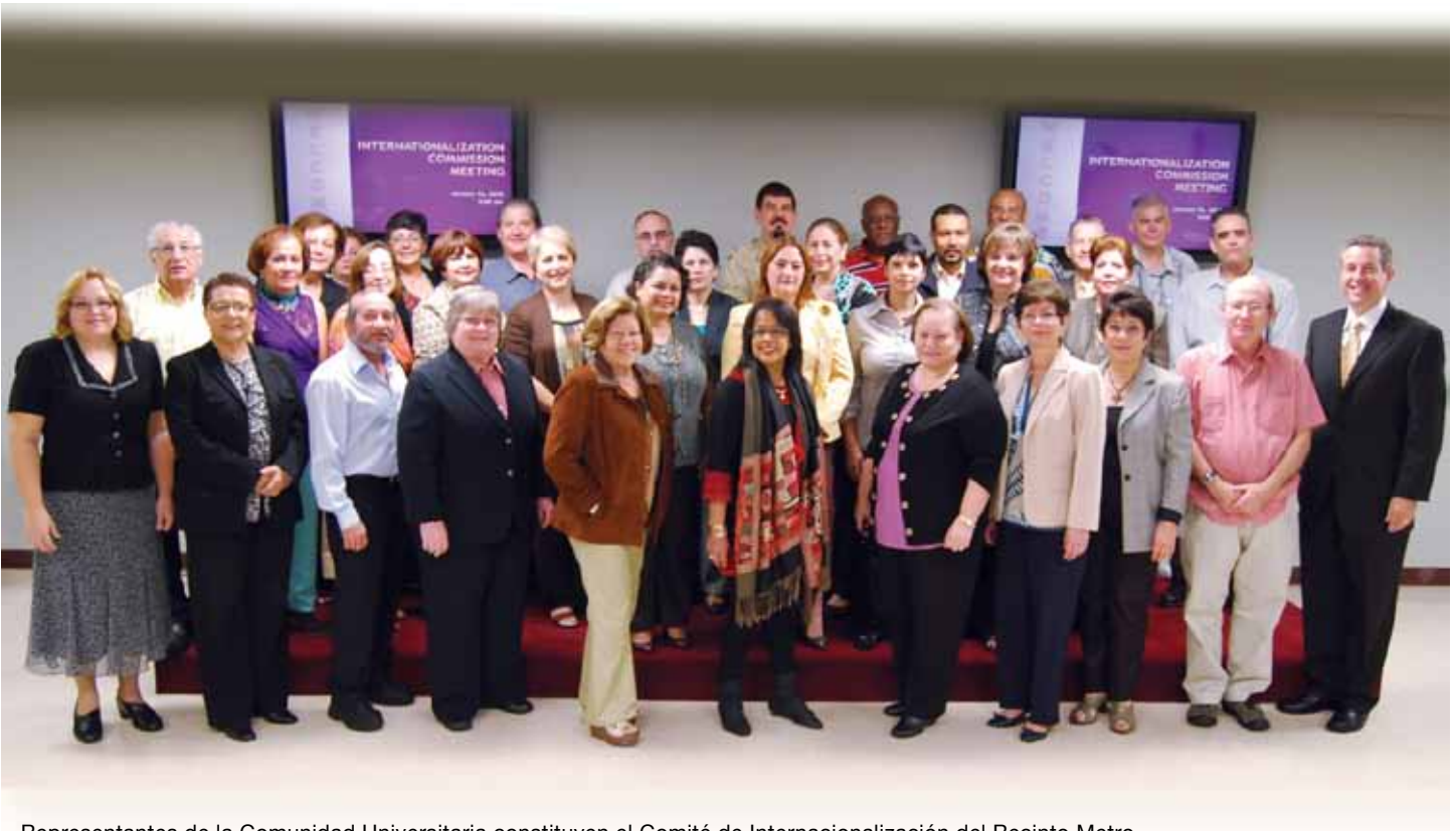
Representantes de la Comunidad Universitaria constituyen el Comité de Internacionalización del Recinto Metro.