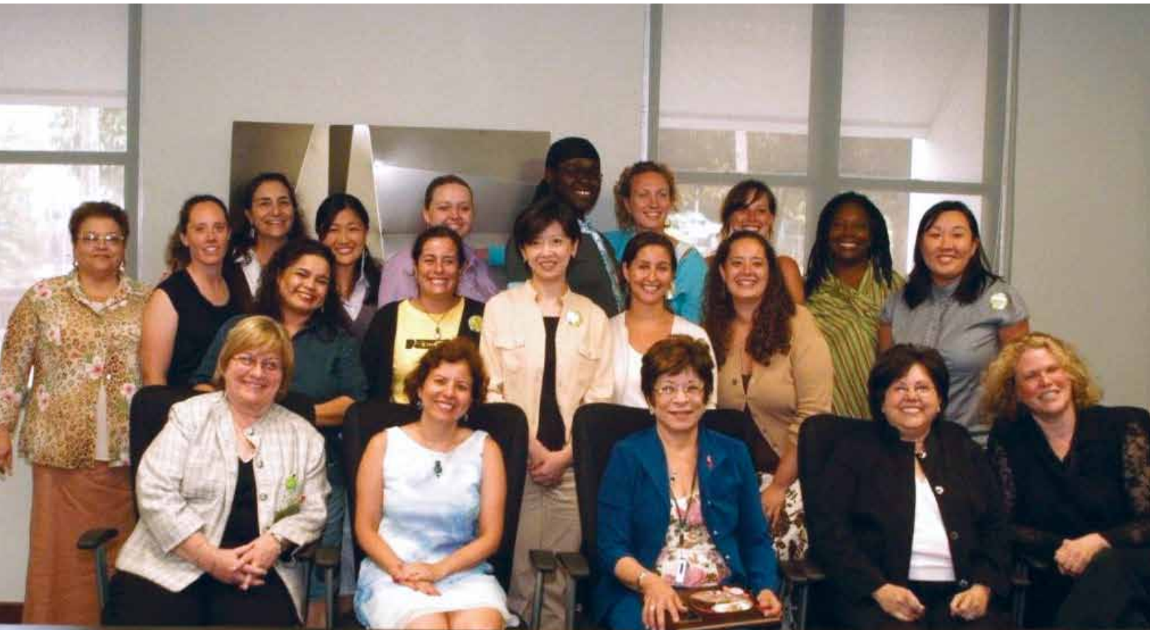
Grupo de Estudiantes de Trabajo Social de Boston University durante su experiencia de inmersión en el Recinto.