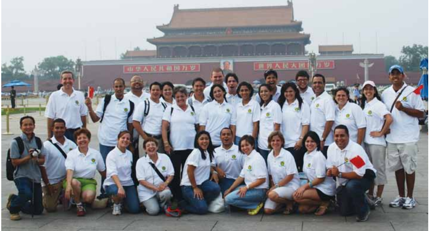
Grupo de estudiantes del curso Introducción a los Negocios en China, durante su visita a la Ciudad Prohibida en Beijing, República Popular China.