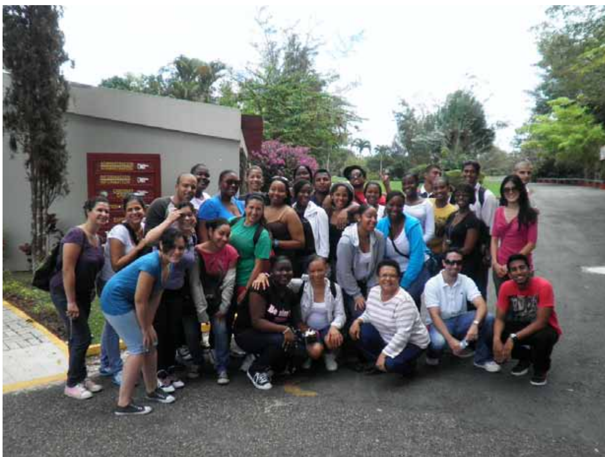
Estudiantes Internacionales del Recinto, disfrutan de una actividad cultural en el Parque de las Cavernas del Río Camuy.