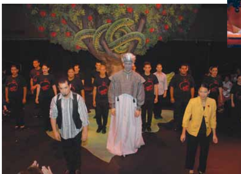
Estudiantes del Recinto Metro durante varias presentaciones del Taller de Teatro.