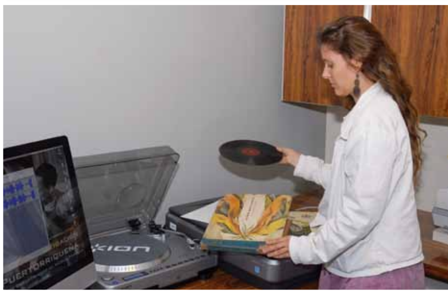
Los estudiantes del Recinto Metro, tienen la oportunidad de desarrollarse en la única Institución Universitaria que cuenta con un centro funcional dedicado a promover el estudio y la investigación de las músicas puertorriqueñas.

Investigación de la Música Puertorriqueña (CEIMP). Con la creación del CEIMP la Universidad Interamericana se pone a la vanguardia de los estudios culturales de la música en la Isla. Hasta el momento, es la única institución universitaria con un centro funcional dedicado a promover el estudio y la investigación de las músicas puertorriqueñas. Este es un espacio habilitado para que tanto estudiantes, como académicos y miembros de la comunidad general puedan tener un contacto directo con memorabilia, escritos, fotos, primeras ediciones de libros y partituras impresas y